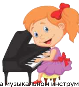
Играть на музыкальном инструменте: