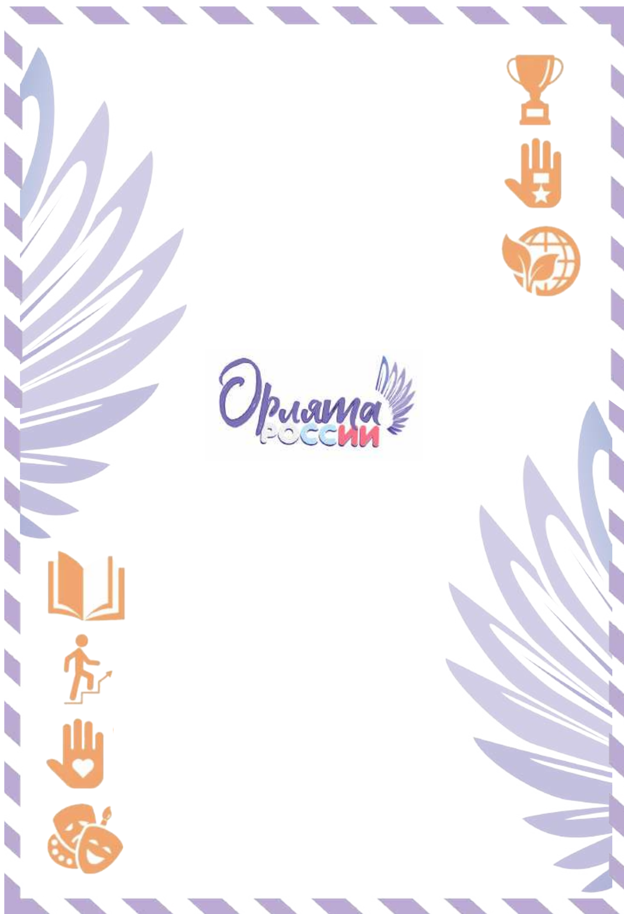
Рис. 2. Обратная сторона «Письма в Будущее»