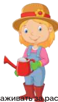
Ухаживать за растениями: