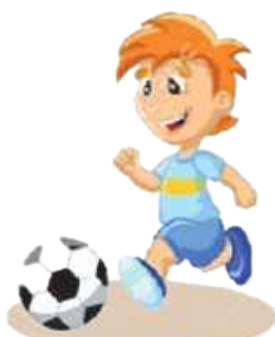
Играть в футбол: