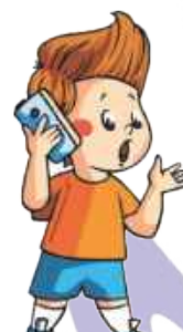
Разговаривать по телефону: