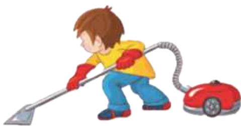
Наводить порядок дома: