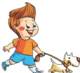
Гулять, играть с собакой: