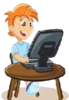
Играть в компьютерные игры: