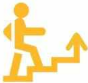
Логотип трека «Орлёнок – Лидер»

Ценности, значимые качества трека: дружба, команда