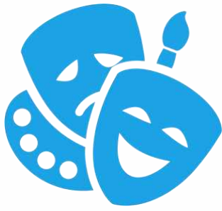
Логотип трека «Орлёнок – Мастер»