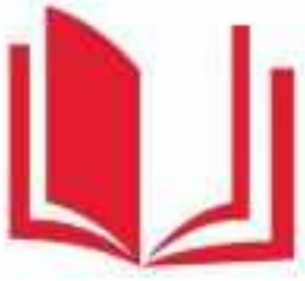
Логотип трека «Орлёнок – Эрудит»