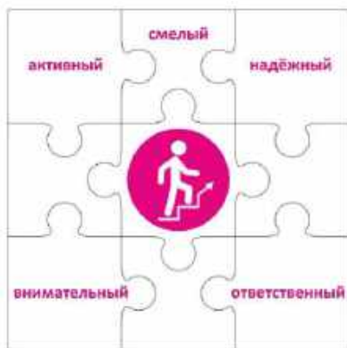
Конструктор «Лидер» 2 класс

Чтобы быть лидером, нужно много знать, уметь вести за собой, постоянно развиваться. Личность лидера многогранна, она словно складывается из множества разных пазлов, которые в целом дают яркую и интересную картинку. Конструктор «Лидер» представляет собой большой пазл, где центральный элемент – символ трека – человек, поднимающийся вверх по лестнице. Остальные части этого пазла – элементы небольшого размера, примерно формата, на каждом из которых в левом верхнем углу написаны по одной букве из алфавита.