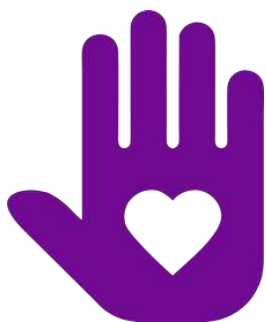
Логотип трека «Орлёнок – Доброволец»

Реализация трека проходит для ребят 1-х классов в начале декабря, но его тематика актуальна круглый год. Важно, как можно раньше познакомить обучающихся с понятиями «доброволец», «волонтёр», «волонтёрское движение». Рассказывая о тимуровском движении, в котором участвовали их бабушки и дедушки, показать преемственность традиций помощи и участия. В решении данных задач учителю поможет празднование в России 5 декабря Дня волонтёра.