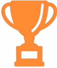
Логотип трека «Орлёнок – Спортсмен»

Ценности, значимые качества трека: здоровый образ жизни