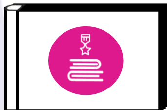
Альбом хранителя исторической памяти

Символ «альбом Хранителя» многозначен и достаточно ёмок в своём воплощении. Исходя из возможностей детского коллектива, уровня его сформированности и вовлеченности в коллективно-творческую деятельность, педагог вместе с детьми может придумать форму альбома Хранителя, где можно разместить историческую летопись класса, района, города и всей страны. Это могут быть переплетенные между собой чистые листы для рисунков, фотографий, открыток, объединённые общей тематикой и историей.