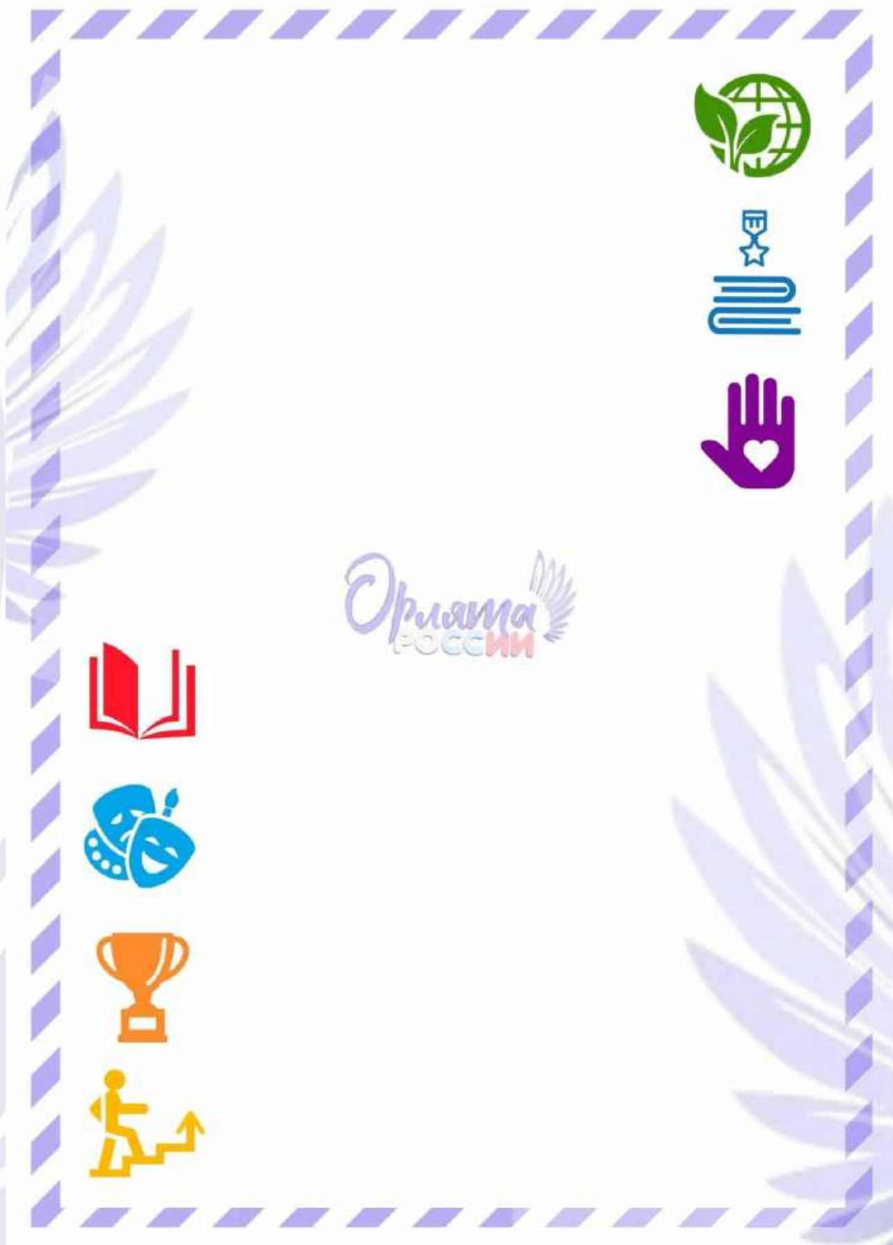
Рис. 2. Обратная сторона «Письма в Будущее».