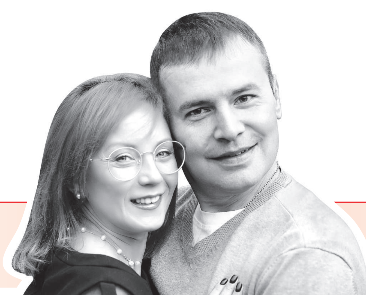
Семья, родители четырех детей